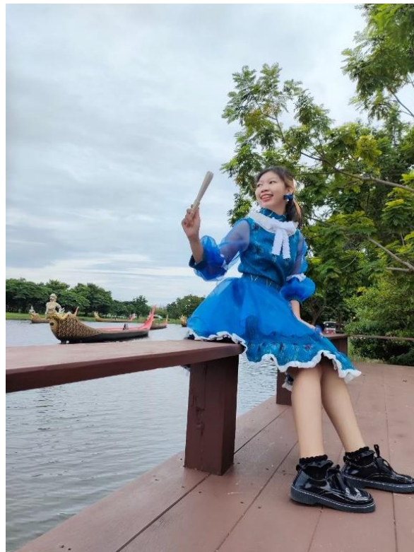
คอลเลคชั่นที่ 2