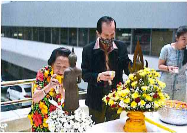
๑๒. ภาพกิจกรรมของโครงการ (ไม่เกิน ๖ ภาพ)