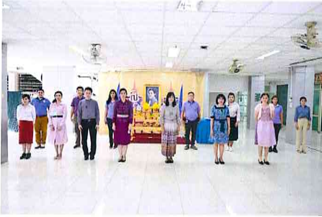
๑๒.ภาพกิจกรรมของโครงการ (ไม่เกิน ๖ ภาพ)