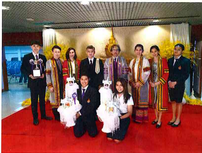
๑๒. ภาพกิจกรรมของโครงการ (ไม่เกิน ๖ ภาพ)